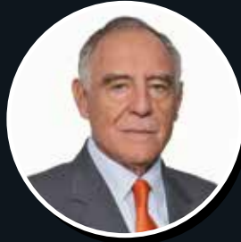
Paco Rosendo Moncayo Gallegos, consejero de Gobierno de Seguridad Nacional del Ecuador