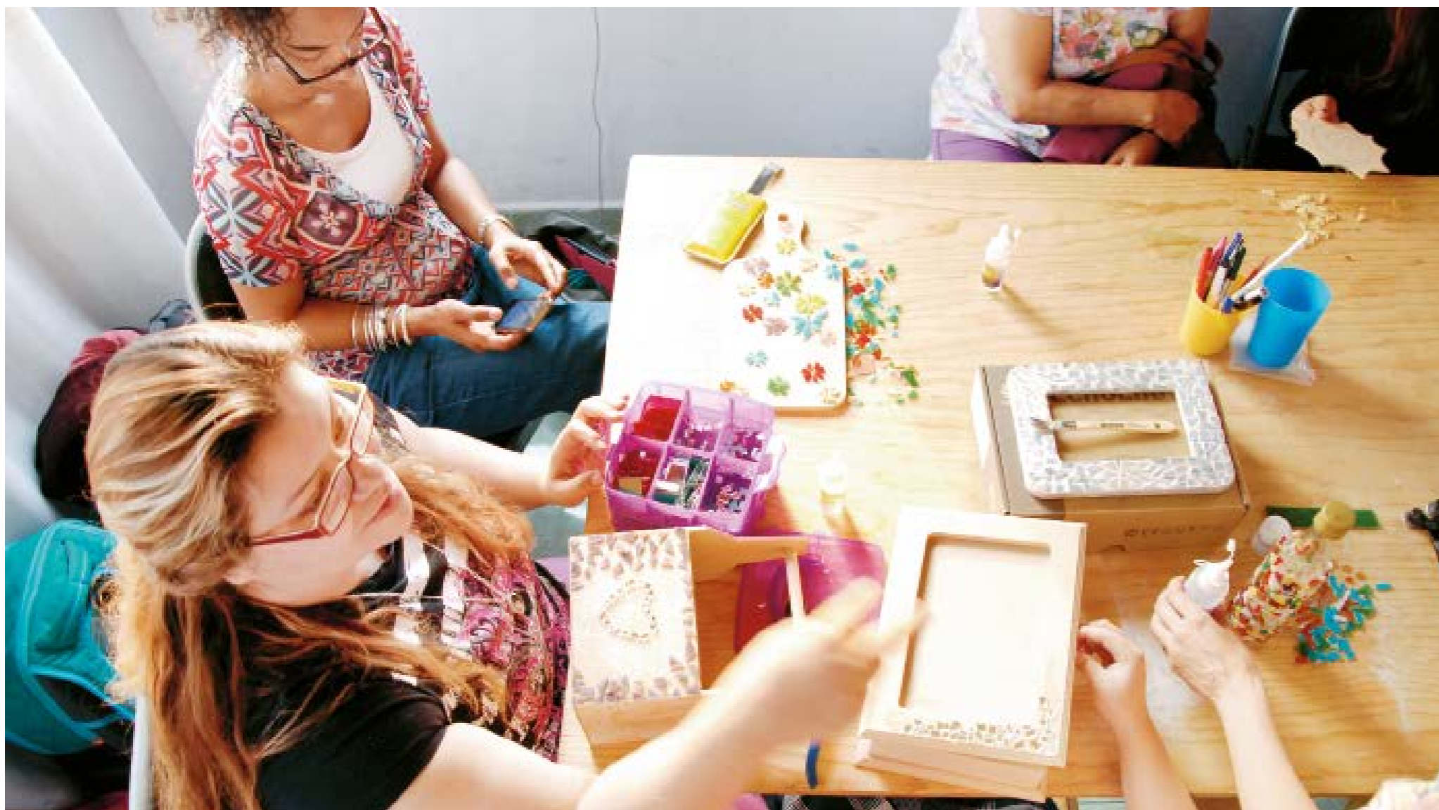
Apoyo: En el Centro para la Inclusión social del Sordo (IncluSor) se ofrecen diversos talleres para las personas sordas.