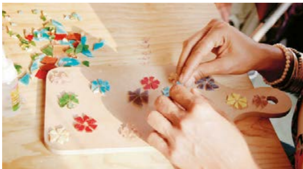
Complemento: También imparten talleres de joyería y lectura, así como de escritura en español.