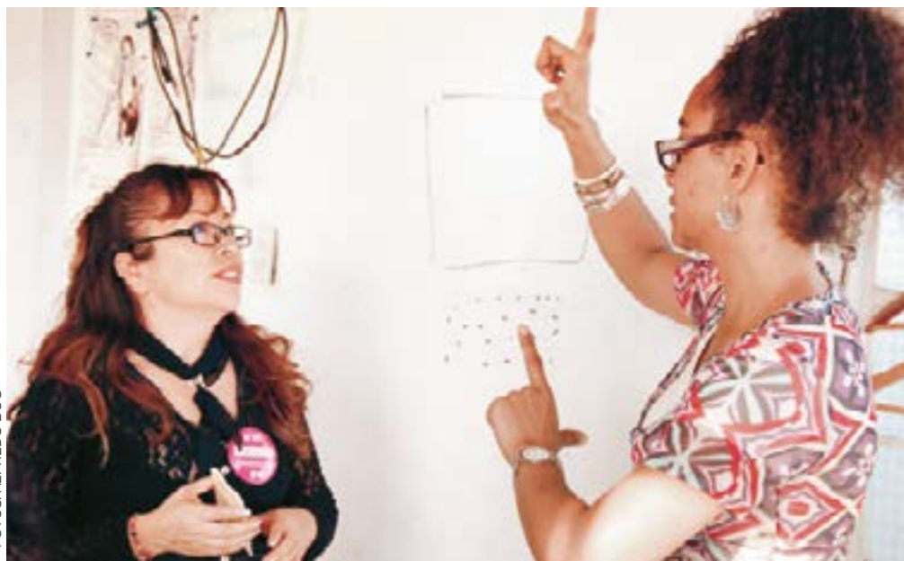
Lenguaje: Ofrecen un curso para enseñanza de lengua de señas.